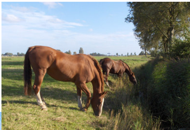
▲ Berthus wijdt zich – met Tarzan (voorground) aan zijn zijde - weer voor 100% aan zijn hoofdtaak: eten!

Wat hebben paarden het goed als ze dag en nacht met elkaar in zo'n grote wei met volop gras staan. Het mooiste paardenleven dat er is. Deze zomer kon dat tot eind september. Het was weliswaar niet een echt mooie zomer voor mensen, maar wel prima 'paardenweer': de temperatuur was goed, niet te koud en niet te warm. Af en toe een fikse bui, dat is goed voor het gras en de paarden droogden weer snel op. Maar het regende geen dagen of nachten lang.