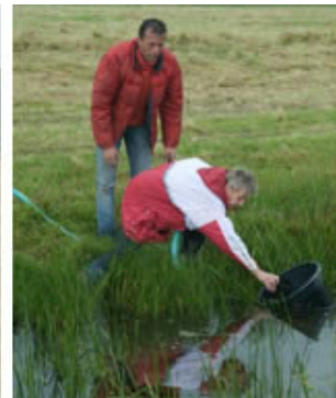
Installatie van de pomp

De eerste twee weken stonden er in de verschillende weilanden in totaal 29 paarden, daarna gingen er iedere week een aantal paarden en pony's terug. Na een maand stonden onze vijf als enigen nog in de wei... Die wei eindelijk voor onze vijf alleen, dat was duidelijk een opluchting voor Berthus: geen concurrentie meer... Want ruïn Bobby, een groot en dominant paard dat twee weken bij onze pensionado's in het land stond, viel bij Tarzan duidelijk in de smaak. Zo'n knappe, jonge, grote vent, dat vond ze wel wat... Tarzan liep als het even kon steeds bij Bobby in de buurt en dat zinde onze Berthus natuurlijk niet: Joepie, Joepie was gekomen, had z'n meisje meegenomen ... Hij had er volop werk aan om Tarzan weer aan zijn kant te krijgen. Zorgen dat hij tussen Tarzan en Bobby in liep, haar niet te veel alleen liet met Bobby (pappen en er bij blijven!) en ondertussen moest hij er ook om denken zelf geen mot te krijgen met Bobby... Na het vertrek van Bobby en Tornado had Berthus zijn dame weer voor zich alleen en kon hij zich volop wijden aan zijn belangrijkste bezigheid: grazen!