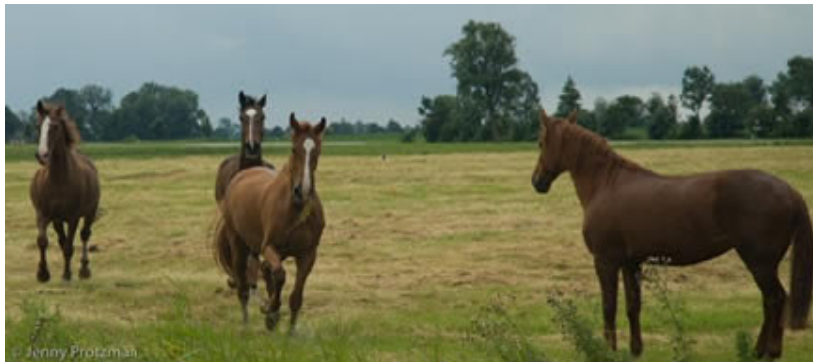
Foto's Jenny Protzman: Berthus, Tornado, Bobby en Jane net in de wei.

Bij de tweede rit was het gelukkig droog geworden. Berthus werd vervoerd in een trailer voor twee paarden. De andere vier pensioenpaarden reden met de grote wagen van de manegehouder mee. Berthus was een van de paarden die het eerst werd uitgeladen. In de trailer stond hij ons al luid hinnikend op te wachten. Je hoefde hem echt niet te vertellen waar hij was. Hij herkende direct die geweldige plek en was door het dolle heen van enthousiasme! Ik moest Berthus met alle kracht in bedwang houden en rondje na rondje met hem draaien om hem op zijn plek te houden. Want hij moest nog even wachten op Bobby en Tornado, twee paarden van particuliere eigenaren die mee de wei ingingen, voor hij los mocht. Eindelijk mocht zijn halster af en in één beweging schoot hij in de galop en daverde in de hoogste versnelling door het land. Jane, Tarzan, Quido en Ginger deden het iets rustiger aan om in de wei te komen, maar hun halster was nog niet af of ze gingen er in net zo'n vaart vandoor.