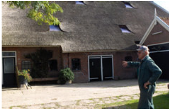
De heer Hotsma bij de boerderij

het te slecht weer is, in ieder geval een loopstal waar ze met zijn vijven rond kunnen scharrelen. Maar als het droog weer is en de wei niet te nat, kunnen ze ook midden in de winter fijn naar buiten. Op zondag, 30 september gaan we Berthus, Quido, Jane, Tarzan en Ginger naar hun nieuwe adres brengen: niks stress met vervoer in een trailer, maar lekker lopend, samen met de verzorgclub!