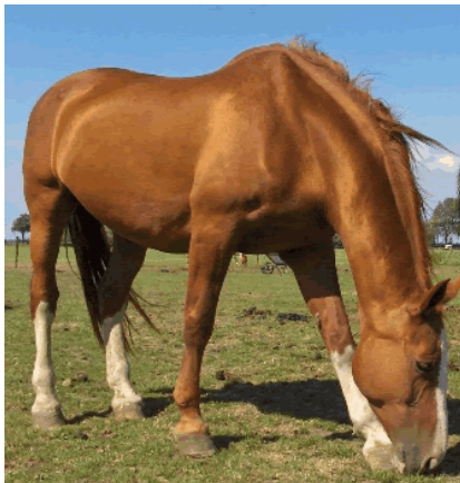
Stoere Tarzan, op het droge....

nou joh! We zijn hieieier!!” En dan komt Tarzan aarzelend de box uit en tuurt een tijdlang zorgelijk in 'het diepe'. Het ziet eruit alsof ze voor het eerst van de hoge duikplank moet springen... Maar ten-slotte, ja hoor! Uiterst geconcentreerd, heel langzaam en voorzichtig, stapt ze door de plas die hooguit 5 cm diep is... Zodra ze 'op het droge is' schiet ze gelijk in de galop. Op naar de kudde.