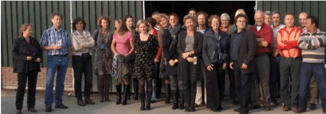
(inmiddels oud-)collega's voor de oude paardenstallen

Na een rondleiding werd de komst uit de wei van onze vijf pensionado's – die zoals gebruikelijk los hun stallen inliepen – door de hele schare gadeslagen. De dapperste collega's vóór het lint... Dat zo'n kudde in alle vrijheid binnenkomt vond ieder bijzonder. En voor mij was het een bijzondere ervaring om collega's van het werk in mijn eigen wereld, die van de oude paarden, te zien. Daarna vertrokken we naar een restaurant in Wirdum voor een geweldig afscheidsfeest. Die hele avond stond natuurlijk in het teken van het (oude manege) paard... Want alle collega's hebben via mijn verhalen in de afgelopen jaren een 'overdosis paard' voor de kiezen gekregen en rekenden nu wel even af .... Met cabaret – er trad zowaar op de muziek van Dance of Devotion een 'Anky van Grunsven' in wedstrijdtenue op! - toespraken, een vriendenboek (met een hoog paardgehalte!) – met leuke, lieve en hilarische bijdragen van alle collega's. Maar ook met een geweldige gift voor de actie 'eigen weidegrond'. Verpakt in een met paarden versierd speeldoosje was er een bijdrage van € 427,= !. De collega's van Noordhoff komen dus op de site en...t.z.t. op het bord bij de weide!