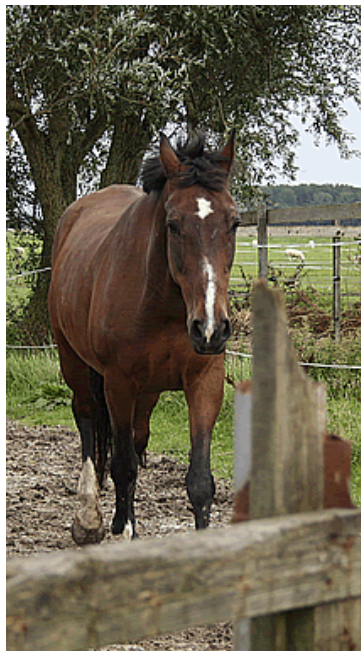
Links: Quido. Gezond en gelukkig