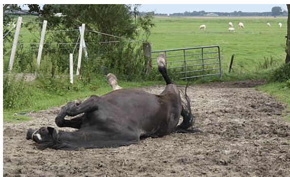
Rechts: Baltimore. Vies en gelukkig

Irma zijn een goed stel samen in hun eigen weidedeel. Over het touw dat ze scheidt van de rest van de kudde, neuzen ze regelmatig met de anderen, maar met z'n tweeën krijgen ze ook rust. Ginger en Paddy zijn een vast duo in het andere weidedeel. 'De Dames Groen' zijn in hele goede conditie. Bij beide is de 'appeltjestekening' op hun vacht te zien. Inmiddels beginnen ze al een dikkere vacht te krijgen in de aanloop naar de winter. Tarzan is stoer, sterk en gezond als altijd. Vaste grote vriendin van Berthus en altijd degene die als eerste de stallen binnenstapt. En ook echt het enige paard van wie Berthus dat toestaat.