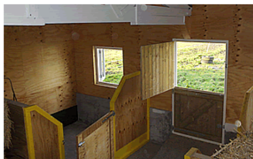
Links boven de oude situatie buiten, onder: binnen. Rechts: na de verbouwing buiten en binnen.

Het was hard werken geblazen de afgelopen maanden. Nadat de achterwand van de 'stroschuur' gestript was, er twee ramen en een kozijn met een dubbele deur waren aangebracht, zijn de twee