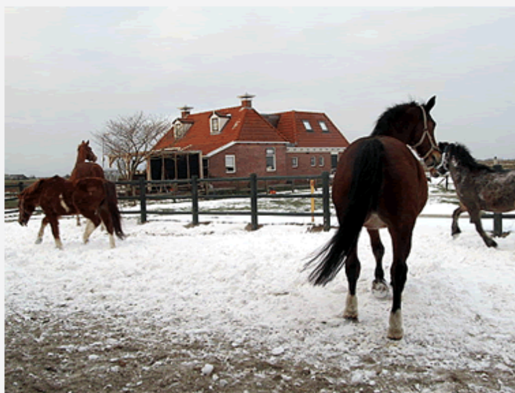
Sneeuw! Linksboven: Macho rolt, Lizzy in galante draf op de achtergrond. Rechts boven: Macho na een rol in de sneeuw. Linksonder: Sandro in actie. Rechtsonder: Snuitje stuift in galop door de sneeuw. Voor: Rolinda.

Qua gezondheid zijn onze paarden en pony's de winter goed doorgekomen. Alleen Fellow kreeg een akelige verwonding aan zijn voet. Daarover straks meer.