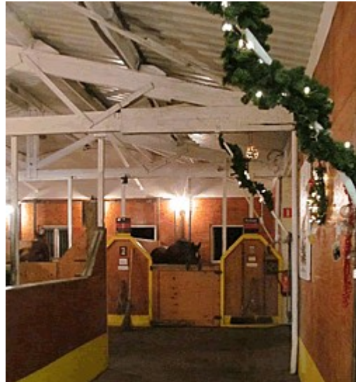
Onze stallen in kerstsfeer

Wie op eerste kerstdag zaterdag 25 december op bezoek wil komen: je bent vanaf 16.00 uur van harte welkom . Mail even of je komt en met hoeveel personen. De anderhalve meter afstand is bij ons prima te houden en de ventilatie is heel goed. Wij zorgen voor warme chocolademelk en een traktatie. Kleed je wel warm! Voor allemaal: gezellige feestdagen en een heel goed en bovenal gezond 2022.