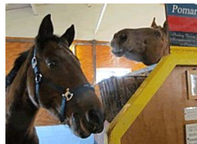
Fellow (re) snuffelend met Pomar

Met alle andere paarden gaat het goed. Alleen voor pony Snuitje hebben we tweemaal de dierenarts moeten bellen. De eerste keer, het was stormachtig weer, ging Snuitje - heel ongewoon voor haar - 's middags in haar stal liggen. Languit. Ze rolde wat, kwam moeizaam overeind, mestte. En ging weer liggen. Ik wachtte een half uurtje of ze opknapte maar dat gebeurde niet. Bij de komst van de dierenarts ging het beter met haar. Ze stond weer, maar was suffig. Hij heeft haar darmen beluisterd, haar hartslag gemeten en haar temperatuur opgenomen. Alles was in orde. Ze heeft nog een pijnstillende injectie gehad. Zijn conclusie was: darmkramp. De tweede keer op zondag 12 december