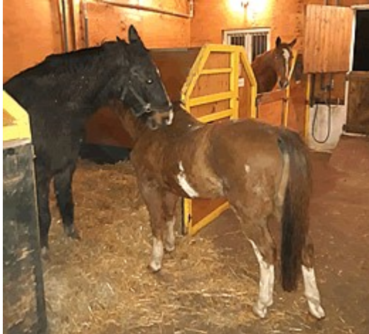
poetsende Jordan (li) met Macho, samen op stal

was ze weer niet in orde. Dit keer was het wel koliek. Op advies van de dierenarts geven we haar 10 dagen lang Psyllium korrels door haar portie Subli , dat is een middel dat kleine ontstekingen in de darm geneest en eventueel aanwezig zand in de darmen verwijdert.