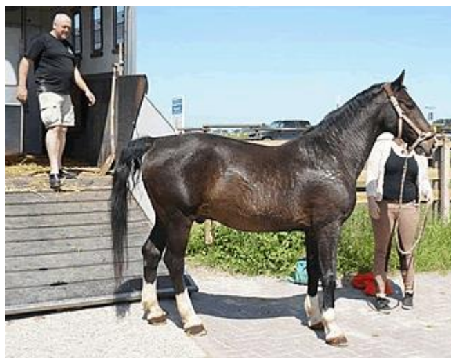
Jordan bij ons in Friesland: The eagle has landed.