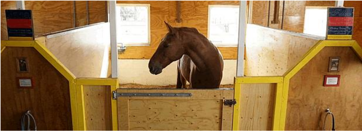
Fellow in 'De Bruidssuite'