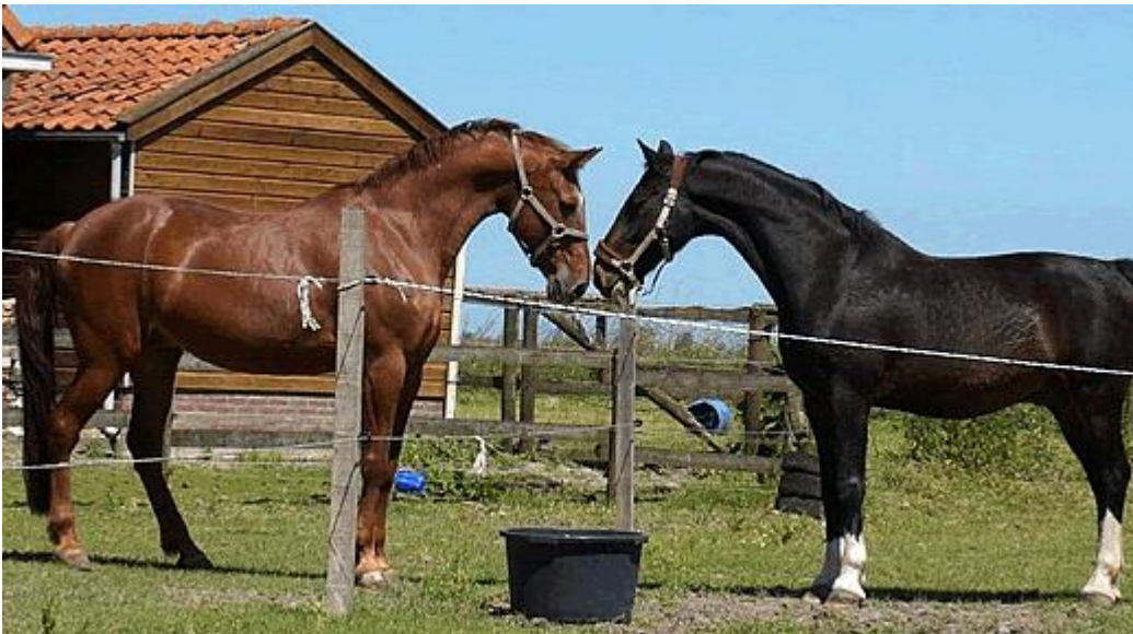
Eerste ontmoeting tussen Twee Grote Mogendheden. li: Fellow, re: Jordan

Tarzan, stoer en sterk als ze is, heeft de hoogste positie in de hiërarchie van haar kudde. Jane heeft van oudsher – als vaste vriendin van Tarzan en destijds Berthus - een hoge plaats. Halinda is nummer drie en zoals te verwachten is, komt nieuwkomer Jordan dan onderaan in de rangorde. Van Jane weten we dat ze ieder nieuw paard tolereert en altijd de eerste is die de nieuwkomer echt accepteert door te gaan poetsen. Tarzan laat direct met oren plat en dreigende stappen duidelijk weten dat zij voor het zeggen heeft, maar ze gaat niet 'jagen'. En bij Halinda vermoedden we toch dat ze niet zo heftig op Jordan zou reageren als op Fellow. Die eerste drie dagen was Jordan voor alle paarden groot nieuws. In de andere wei werd in Fellow 'de hengst' weer helemaal wakker. Die eerste middag en alle dagen daarna liep hij op en neer langs Jordan's weijtje. Oren plat, dreigend met zijn hoofd vér over de omheining uitgestoken en maar één boodschap: "Ik, Fellow! Ben Hier De Baas!"