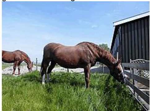
vooraan: Tarzan, achter: Jane

Dit voorjaar begon voor al onze pensionado's op 9 mei met het grote feest: de wei in. Heerlijk eten van vers gras. Eén beeld zegt meer dan 1000 woorden, hieronder de foto's van de eerste weidedag.