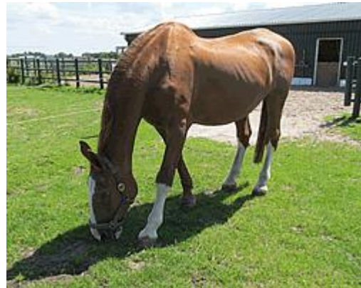
Tarzan in de wei, juli 2017

Bij de komst van Rianne en No Limit was het even spannend hoe beide paarden er op zouden reageren dat ze niet in hetzelfde staldeel staan. Gelukkig bleek dat amper een probleem. Even werd er heen en weer gehinnikt, maar dat duurde maar kort. De ramen van beide stallen stonden open en na een eerste verkenning van hun stal genoten ze beide met het hoofd uit het raam van het uitzicht. De kuil was direct aan de beurt om gegeten te worden en het speciale oude paardenvoer – voor hen eten dat ze niet kenden - ging er met smaak in en werd tot de laatste kruimel toe opgelikt. Onze