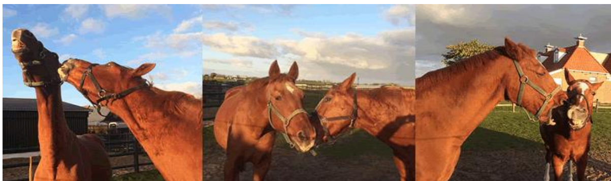
Fellow (links) en No Limit spelen non-stop het 'ruinenspelletje'