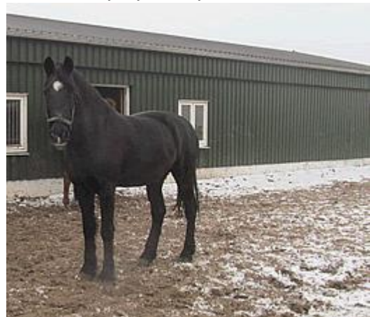
Sandro in de sneeuw

gewoontes met voeren en verwennen zijn hem helemaal vertrouwd geworden. Zijn stal ligt vlak naast de inloopkast waar in een grote mand ook de appels en wortels worden bewaard. 's Avonds als ik na de laatste voerbeurt met kuil en Subli "het toetje" uit die kast haal, steekt Sandro zijn hoofd zo ver hij kan over zijn staldeur, schraapt met zijn voorhoef over de grond, bromt zachtjes en geeft mij duwtjes tegen mijn rug en arm met maar één boodschap: "Geef hier die lekkere hapjes!" Want hij krijgt altijd als eerste zijn toetje. Maar ook wanneer de buurkipjes rondscharrelen bij die kast – wetend dat daar de biscuitjes opgeborgen worden die ik ze voer – is Sandro direct paraat: hij wil ook een koekje! En die krijgt hij natuurlijk ☺ Een goed paardenleven, dat is het voor Sandro en alle andere pensionado's.